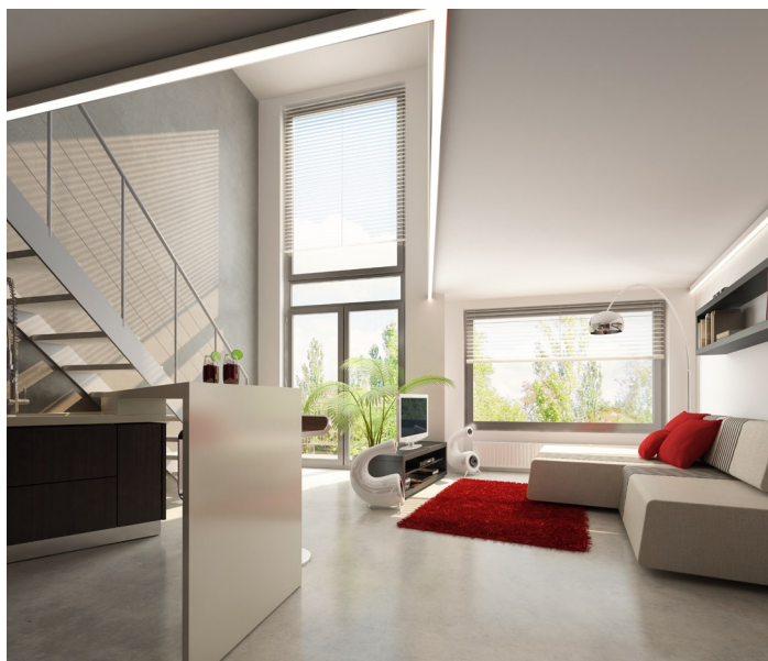
VELKÁ OKNA dokážou maximálně využít denní světlo, což dodává bytu příjemnou atmosféru.