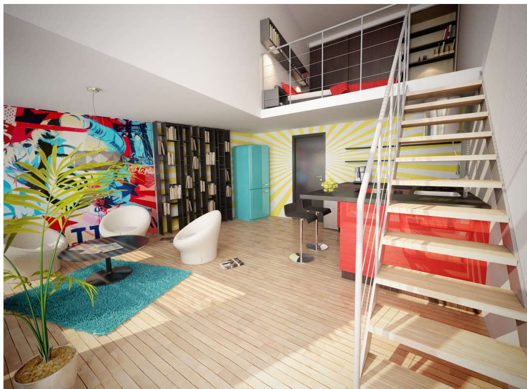
VARIANTU EXTREME jistě ocení ti, kdo upřednostňují extrafvgantní bydlení a nebojí se experimentovat.

A jak takových úspor lze dosáhnout? „Vsadili jsme na dobré zateplení fasády, v oknech jsou izolační trojskla, na střeše jsou solární kolektory, rekuperace tepla. Ekologickým bonbónkem je retenční dešťové vody, kterou pak obyvatelé domu zalévají zahrádku,“ říká manažerka developmentu Klára Vlková z developerské společnosti