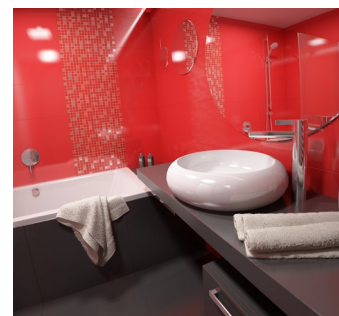
VYSOCE KVALITNÍ OBKLADY a keramika jsou samozřejmou součástí standardu, který je zahrnut v ceně bytu.

umístění. Moderní novostavba je pár minut pěšky od stanice tramvaje nebo metra Palmovka, nedaleko O2 arény a nákupního centra. V blízkosti přitom vede cyklostezka a kousek od domu je park a řeka. V místě je zároveň veškerá občanská vybavenost, včetně řady sportovišť. Podrobnosti o celém projektu najdete na www.x-loft.cz , na telefonním čísle 733 123 400 si můžete objednat prohlídku vzorového bytu.